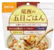
写真は「五目ごはん」